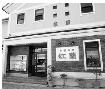
中国料理紅蘭 瑞浪市寺河戸町1-114-2

これが趣味といったものはなく、興味を持った色々な事を今までやってきました。その中で、今も続けているのは、EM菌を育てて、肥料を作って庭の花に使用したり、臭い消しに使ったりしています。