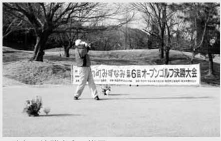
▲昨年の決勝大会の様子

予選開催期間 平成29年1月10日(火)~2月15日(水) ※各ゴルフ場によって開催日が異なります。