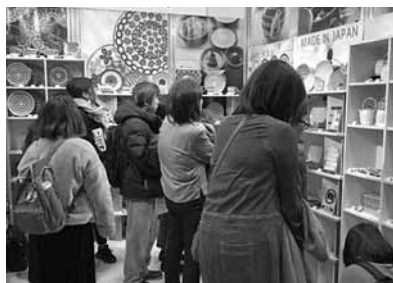
▲株アワサカ ブース風景

サカ、株小倉陶器、株生活の木が3社がブースを作り出展した。今回は、「暮らし・デザイン・新時代 Good Design for Happy Life」をテーマに開催され、開会式では、出展者を代表して株生活の木 代表取締役 重