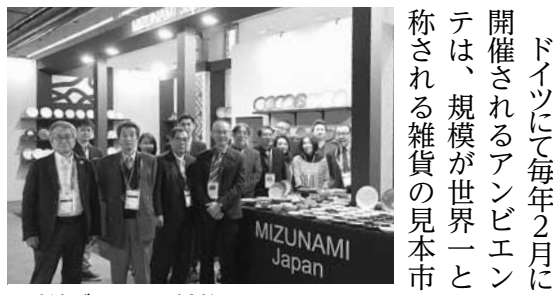
▲瑞浪ブースの関係者

である。瑞浪市内で製造、企画されている陶磁器製品が展示される瑞浪市のブースは、毎年独自の商品群を展示してきたことで「瑞浪ジャパン」としてのブランド価値が認識されている。