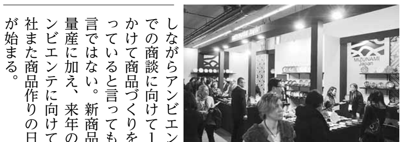
▲多くの来場者でにぎわう瑞浪ブース

いる他国の陶磁器メーカーの商品とは一線を画した展示を行うことができた。また初めての試みとして、瑞浪市内のメーカー数社と協力し各々の特長を生かしたコラボレーションの商品づくりを行った。「今まで無かったモノ」をコンセプトに各社デザイナーのアイデア及び、各々の製造技術を共有することで商品の幅を大きく広げることができた。