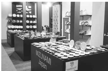
▲新たなレイアウトになった瑞浪ブース

今年には陶磁器輸出商品の転換時期と考え、新たな商品開発の取り組みを行った。5年程前から日本製のパット印刷の輸出商品が欧米でブームとなり、美濃地区全体にも同様の傾向が広がった。しかし昨年からは他国の類似品