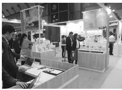
▲株生活の木 ブース風景

サカ、株小倉陶器、株生活の木が3社がブースを作り出展した。今回は、「暮らし・デザイン・新時代 Good Design for Happy Life」をテーマに開催され、開会式では、出展者を代表して株生活の木 代表取締役 重