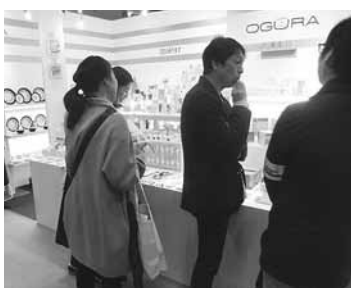
▲株小倉陶器 ブース風景

第85回東京インターナショナル・ギフト・ショー春2018の中核として、LIFE × DESIGN が1月31日～2月3日の4日間開催された。瑞浪市産業振興販路開拓支援事業の一環として、瑞浪市から株アワ