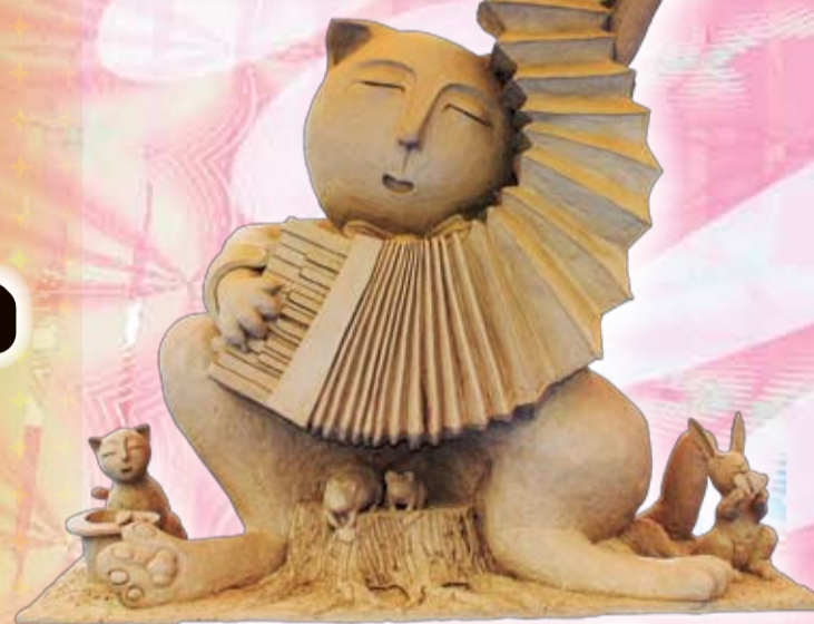
第20回クレイオブジェコンテスト グランプリ作品