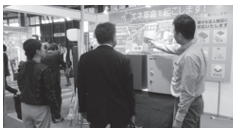
▲商品やサービスを効果的にPR出来る絶好の場

メッセナゴヤで開催されます。今年のテーマは交わり起こる相乗効果「商機融合」です。瑞浪市からは、5社7ブースが出展します。会期中には、各界のトップによるビジネスセミナーや海外投資セミナー、ステージイベントなども開催されます。