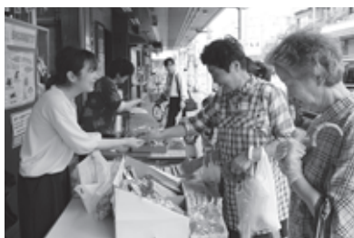
▲前回の百縁商店街

していただきますと、当日受付での手続きがスムーズになります。各種セミナーについても参加無料(一部有料)ですが、事前予約が必要な場合もございますので、詳しくはメッセナゴヤホームページをご参照ください。