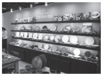
▲展示会ブース風景

LIFE × DESIGN』は新しいライフスタイルの提案からリノベーションや匠の技、DIYを活用した住まいづくりまで、人々の暮らしが、より楽しくわくわ