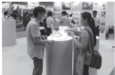
▲バイヤーとの商談中

く、ドキドキするような革新的な商品やアイデアを集めて、「暮らし・デザイン・新時代」をテーマに開催された。来場者のほとんどが商談を目的とするバイヤーであるのもこのトレードショーの特徴であり、成約に直結する確率も高くなること期待される。