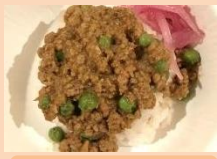
キーマカレー タネノマク