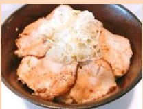
チャーシュー丼 Food Bar MAKOTO