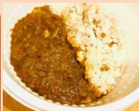
トマトカレーライス カフェ燈