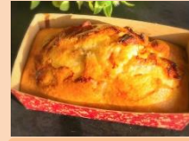
ケランパン ao cafe