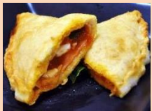
パンツェロッティ VITA