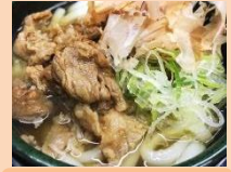
スタミナ肉うどん 焼肉 与志多