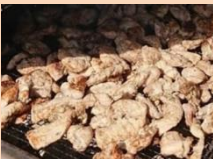
ジャマイカンポークグリル キッチンおいしや