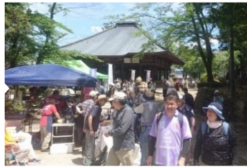
土岐町周辺の史跡を巡って…