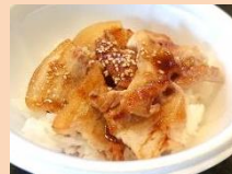
焼肉丼 焼肉キッチン安藤