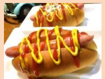
ポーノポークドッグ Perch