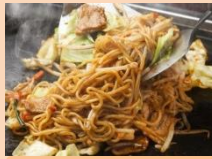
鉄板焼きそば さくらや