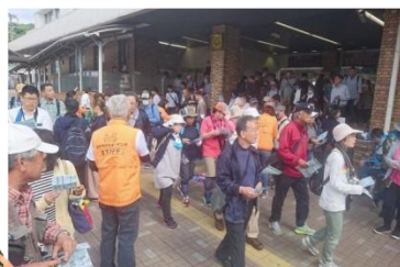
JR瑞浪駅を出発して…