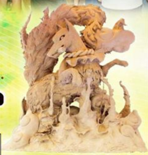
第21回クレイオブジェコンテスト グランプリ作品