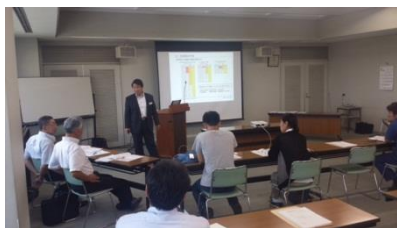
ワークショップ風景(イメージ)

東京海上日動火災保険(株)様に協賛頂き、台風シーズンに入る前に、「BCPワークショップ」を無料開催致します!!