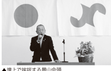
▲壇上で挨拶する景山会頭

瑞浪商工会議所第119回通常議員総会を3月27日(水)に開催。令和6年度事業計画が次のように決まりました。