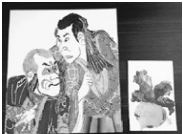
▲色彩豊かなちぎり絵です。是非展示をご鑑賞ください。