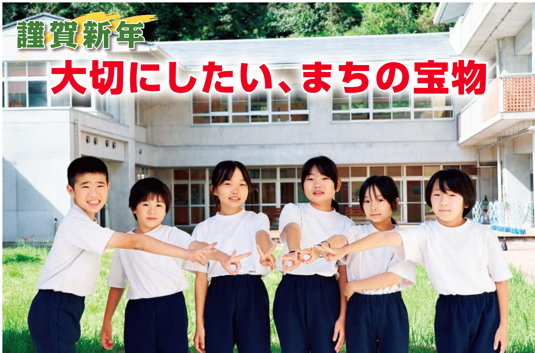
瑞浪市立 日吉小学校 5 年生（午年生まれの子ども達） “私たちが『住み続けたい!』まちの自慢とアイデア”を3面でご紹介!

発行所 瑞浪商工会議所 〒509-6121 岐阜県瑞浪市 寺河戸町 1043-2 ☎ 0572-67-2222 FAX 0572-67-2230 編集責任者 瑞浪商工会議所 広 報 委 員 会 購読料 1 部 3 0 円 印刷 丸理印刷株式会社