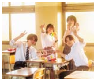
進化が止まらない高校生たちの感性にご注目

今年も中京高校写真部が瑞浪市民図書館にて作品展示を行います。なんと今回は、名古屋のSONYストアでの展示も成功させ、ますます表現力に磨きがかかっています。若き写真家たちの感性が光る作品の数々を、ぜひ会場でご覧ください！ ■日時 1月9日(金)～25日(日) ■場所・お問合せ先 瑞浪市民図書館 ☎68・5529