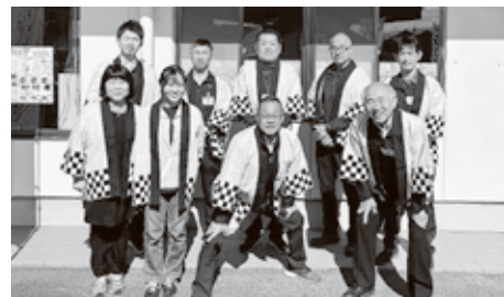
▲我々にお任せください！