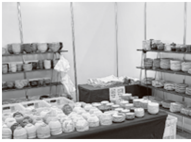
▲山喜製陶(株)のブース

3月5日から5日間、ポルトメッセなごや(名古屋市港区)にて「やきものワールド2026」が開催されました。全国から約240ブースが集結し、土日を中心に大行列ができる盛況ぶりです。5日間の来場者数は計4万1千人に達しました。