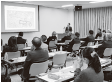
▲駅周辺再開発について説明を受ける会場の様子

質疑応答では、プロジェクトメンバーから率直かつ具体的な質問が相次ぎました。 〔集客への懸念〕「3万人規模の町に年間40万人という大規模な集客が可能なのか」との問いに対し、市側は「東濃地方の方をはじめ、中央線沿線からの関係人口を増やしたい」と回答しました。 〔成功指標（KPI）重要業績評価指標〕