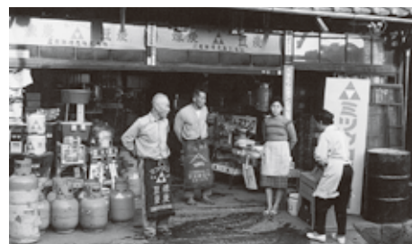
▲昭和中期の松野屋商店