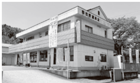
▲現在の小田店の様子