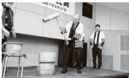
▲100年記念式典で行われた餅つきの様子

これからも松野屋商店では、地域の皆様にもっと身近に、もっと気軽に頼っていただける存在を目指します。「地球1本の取替えからリフォームまで」対応できる強みを生かし、どんなことでも相談していただけるよう、技術とサービスの向上に努めてまいります。