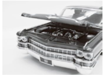
迫力のあるミニカーの展示

コレクターのじじおっさんによるミニカー展示会を行います。国産車・外国車の雑誌とミニカーの集合です。昭和の車雑誌とモーターショーの雑誌と合わせてミニカーの雑誌も展示します。