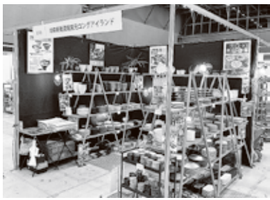
▲(株)ロングアイランドのブース

会場入口では瑞浪の「おひなの会」による色とりどりの土人形がひな壇に飾られ、来場客を魅了しました。瑞浪市産業振興販路開拓委員会の支援を受け、山喜製陶(株)と(株)ロングアイランドが出展しました。その他「新作品展」には小田陶器(株)、「新人アーティスト展」には釜戸町の「ト展」には釜戸町の「Bosque(ボスケ)」がそれぞれ出品・参加し、商品や作品の魅力が強くPRしました。